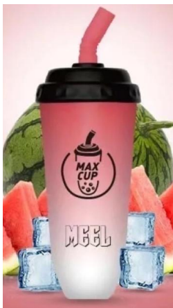
飲料罐造型 (一次性)