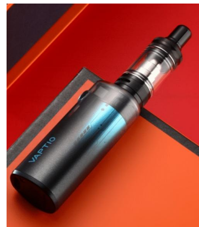
POD 系統( 大煙)