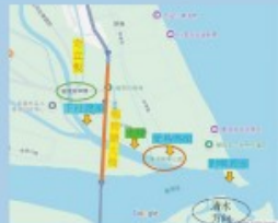
圖二、東港各渡船頭位置示意圖