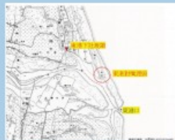
圖一、1904年臺灣地圖中東港出海口的變遷

1960年代「港嘴渡頭」消逝，居民仍在河口停船，1997年簡易碼頭興建，配合榕樹公園，成為居民休閒處所。「下社渡頭」雖因貓里霧平橋建立而沒落。然當地居民有以漁業維生，「下社渡頭」提供居民停船使用。揭示渡船頭即使變遷，依舊與居民生活有所連結。