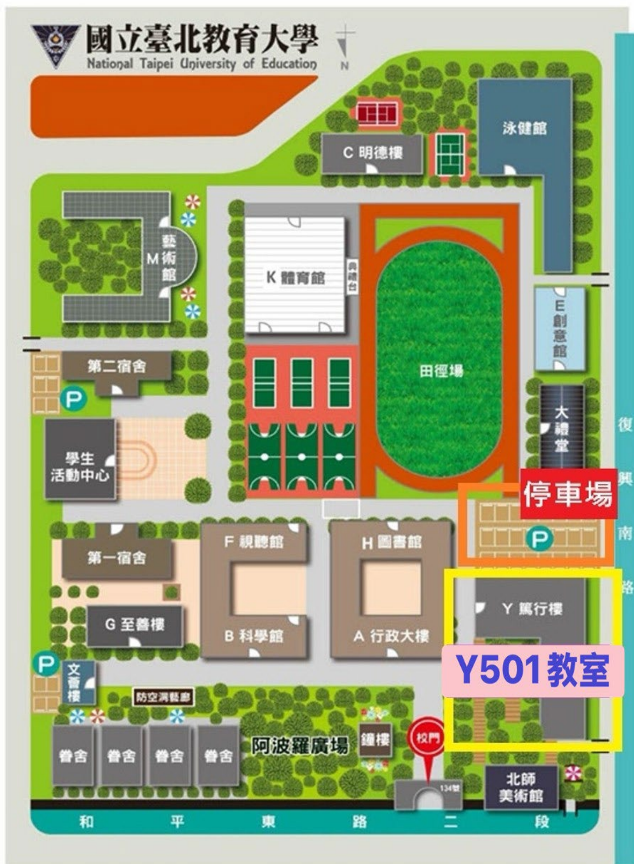
國立臺北教育大學校園平面圖