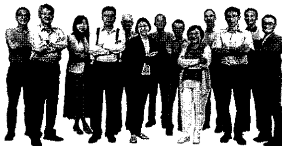
旺宏科學獎評審團陣容堅強