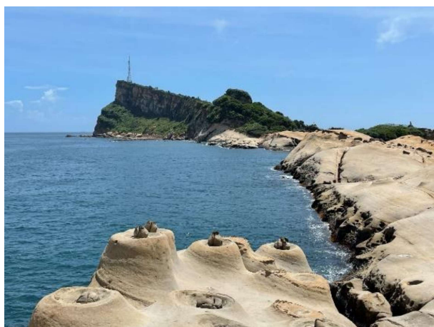
圖 1 台灣地景保育網任選一張地景的照片或自行拍攝或選用照片(請務必註明出處)